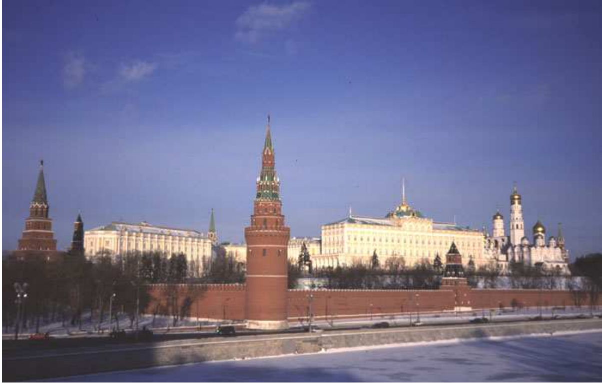
Winterlicher Krenl in Moskau am 23.12.2001.