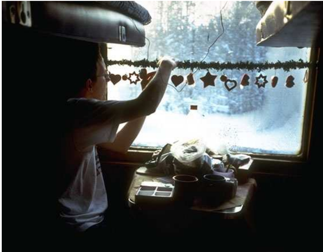
Vorbereitungen auf den Heiligen Abend im "Rossija" zwischen Moskau und Wladiwostok 24.12.2000.