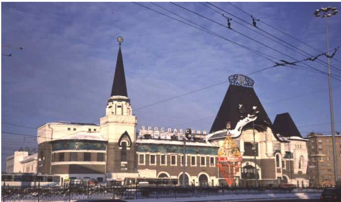
Der Bahnhof wo alles beginnt: Jaroslavskij Woksal in Moskau. 08.01.2002