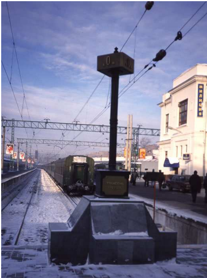
Kilometer 0 am Transsib Obelisk auf dem Jaroslawsker Bahnhof in Moskau. 08.01.2002