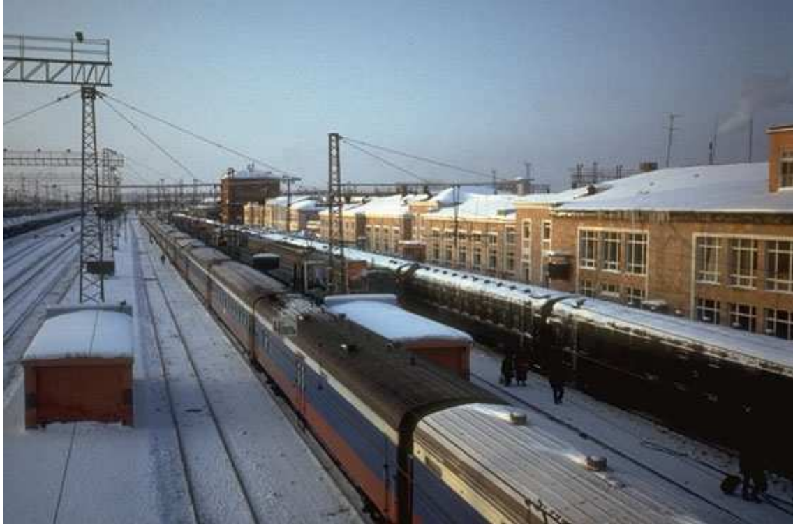
Über den Bahnsteigen des Bahnhofs Perm am 24.12.2000.