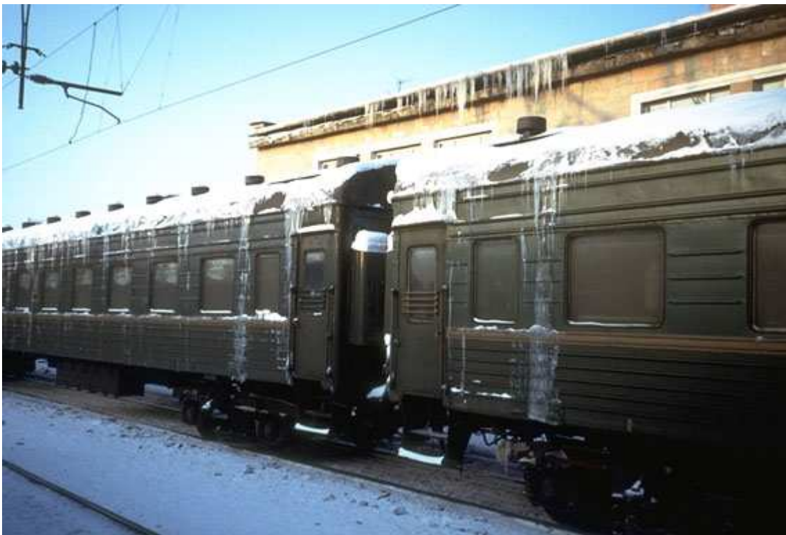
"Väterchen Frost" an zwei Wagen der Russischen Eisenbahn am 24.12.2000 im Bahnhof Perm.