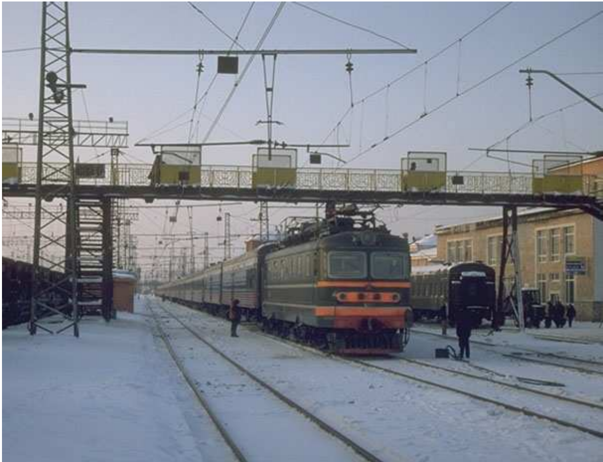
Der "Rossija" mit TschS2-660 im Bahnhof von Perm am 24.12.2000