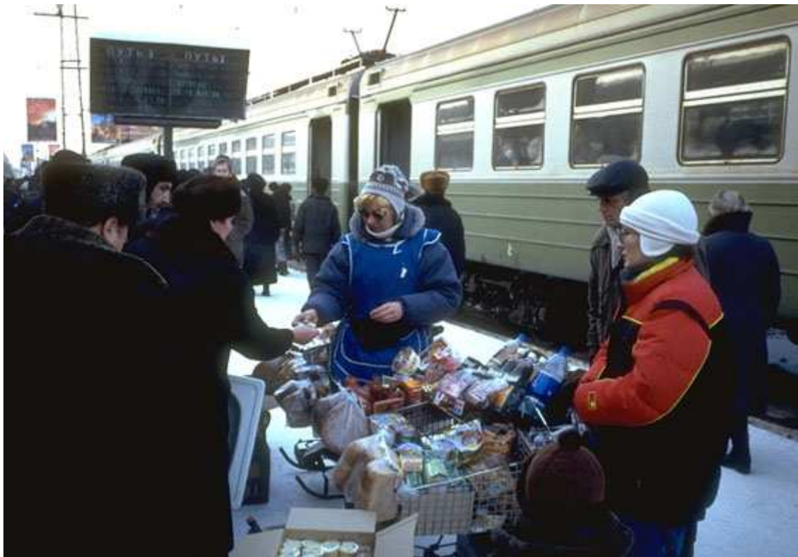
Versorgung mit Proviant auf dem Bahnsteig von Perm 24.12.2000