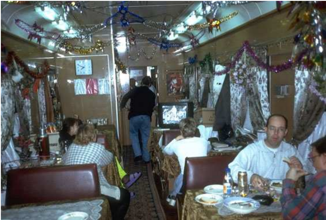
Weihnachtlich geschmückter Speisewagen im "Rossija" 24.12.2000.